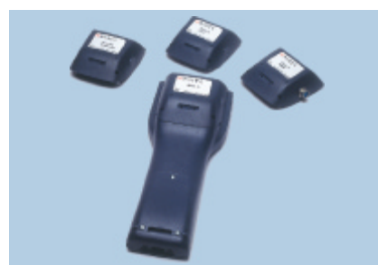
Varie opzioni di raccolta dati