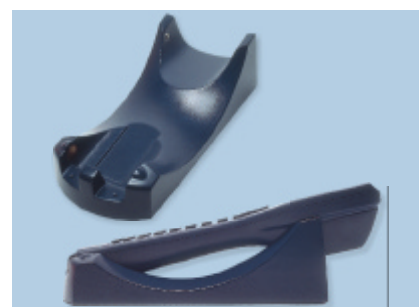
Minec 4x docking cradle