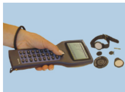
Raccolta dati RFID