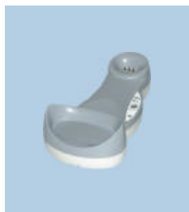
OM - Gryphon™