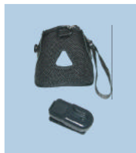
Custodia protettiva da cintura

Il supporto da tavolo e da muro consente una maggiore flessibilità e facilità di utilizzo in ambienti in cui lo spazio di lavoro è limitato.