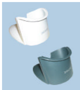
Supporto da tavolo e da muro