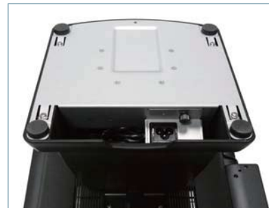
Innovative LCD Stand design with - Cable management - Power brick concealed