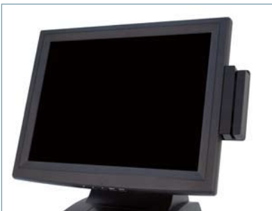
Magnetic Strip Card Reader (USB type)