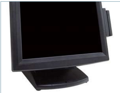
Slim bezel and small footprint